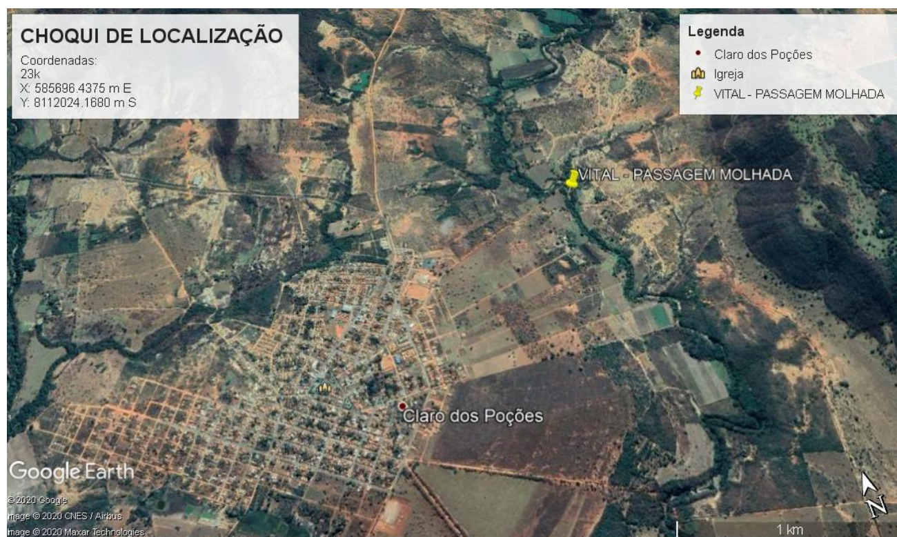
Imagem 01: Localização da área de Construção da Passagem molhada do Rio Traíras em Claro dos Poções/MG. Earth, 2020

A construção da Passagem molhada de Claro dos Poções, está localizado no acesso a Comunidade dos Vital, passagem pelo Rio Traíras. E terá uma área abrangida pelo projeto de cerca de 184,19 m².